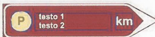
Fig 294 del Codice della strada svolta a destra

LOTTO 3. Realizzazione e gestione di una infrastruttura pubblica Wireless in tecnologia Wi-Fi da realizzare presso le piazze principali (n. 20) e le stazioni ferroviarie (n.7) e presso i beni di pregio (n. 15) di ogni Comune aderente al SAC Alta Murgia, per implementare l'accesso alle informazioni e garantire la connessione per almeno sei mesi al portale web di tourist Experience: http://www.visitparcoaltamurgia.it .