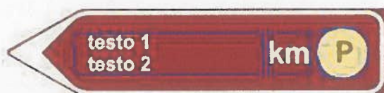
Fig 294 del Codice della strada svolta a sinistra